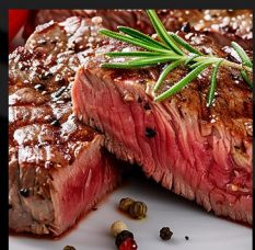
STEAK Z HOVĚZÍ SVÍČKOVÉ BEEF SIRLOIN STEAK STEAK VOM RINDERFILET 250g