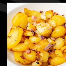
RESTOVANÉ BRAMBORY SE SLANINOU A CIBULÍ ROASTED POTATOES WITH BACON AND ONIONS RÖSTKARTOFFELN MIT SPECK UND ZWIEBEL