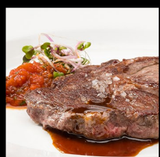
FLAP STEAK 250g