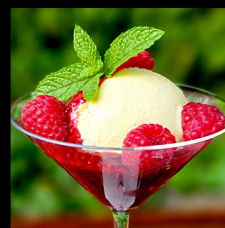
HORKA LÁSKA HOT LOVE HEISSE LIEBE

ZMRZLINA A DEZERT DLE DENNÍ NABÍDKY DESSERTS AND ICE CREAM ACCORDING TO THE DAILY OFFER EIS UND DESSERT NACH TAGEN ANGEBOT