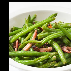
FAZOLOVÉ LUSKY SE SLANINOU BEAN PODS WITH BACON SPECKBOHNEN