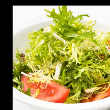
PŘÍLOHOVÝ SALÁT MALÝ SIDE SALAD SMALL BEILAGENSALAT KLEIN