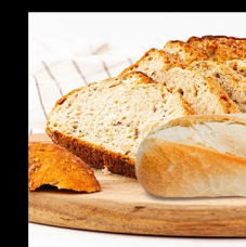
ČERSTVÝ CHLĚB/BAGETA FRESH BREAD/BAGUETTE FRISCHES BROT/BAGUETTE