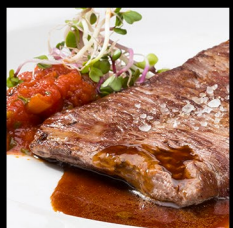
RUMP STEAK 250g