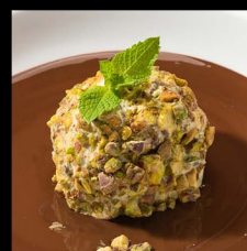
VANILKOVÁ ZMRZLINA V PISTÁCIÍCH a horkou čokoládou VANILLA ICE CREAM IN PISTACHIOS and hot chocolate VANILLEEIS IN PISTAZIEN und heißer Schokolade