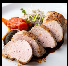
MEDAILONKY Z VEPŘOVÉ PANENKY PORK TENDERLOIN STEAK SCHWEINELENDENSTEAK 250g