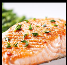
STEAK Z LOSOSA SALMON STEAK LACHSSTEAK 200g

ZEPTEJTE SE OBSLUHY NA SPECIÁLNÍ NABÍDKU STEAKU NA HORKÉM KAMENI! ASK THE STAFF ABOUT THE HOT STONE STEAK SPECIAL! FRAGEN SIE DAS PERSONAL NACH EINEM SPEZIELLEN ANGEBOT FÜR STEAK AUF EINEM HEIßEN STEIN!