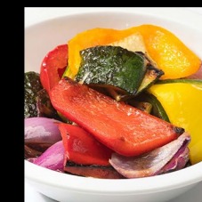
GRILOVANÁ ZELENINA GRILLED VEGETABLES GEGRILLTES GEMÜSE