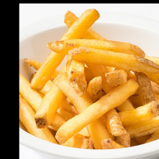
HRANOLKY FRENCH FRIES POMMES FRITES